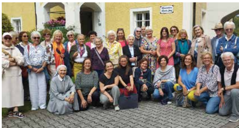
Spotkanie z grupą zwiedzającą muzea w Maria Sorg