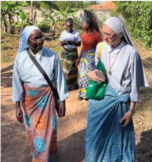
Budowanie relacji to wspólna droga

Braterstwo rodzi się z ludzkiej natury. Jesteśmy zdolni do nawiązywania relacji i, jeśli tego chcemy, potrafimy budować między sobą autentyczne więzi. Bez relacji, które od początku naszego życia nas wspierają i ubogacają, nie mogliby-