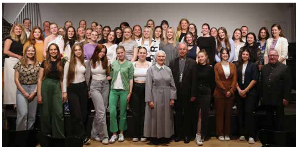
Uczestnicy konkursu o bł. Marii Teresie Ledóchowskiej

Dom Misyjny służy także jako miejsce formacji: spotykają się tu rady parafialne, kandydaci na diakonów stałych, odbywają się rekolekcje dla dzieci. Latem w ogrodzie zatrzymują się harcerze z Francji i Belgii. Dzięki temu, każda z grup, ma możliwość ubogacić się naszym misyjnym charyzmatem.