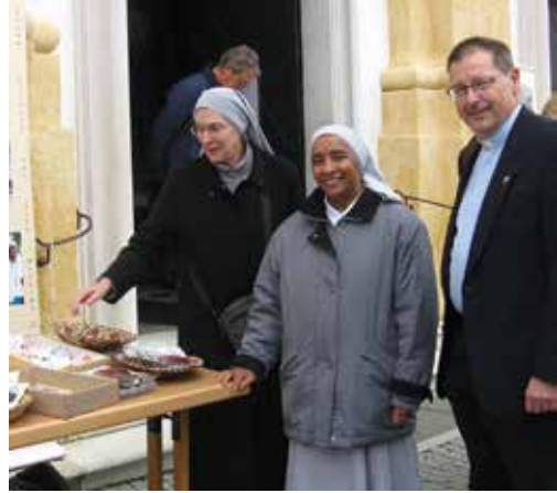
Animacja misyjna w parafiach

Nadal modlimy się o nowe powołania – o serca gotowe należeć całkowicie do Chrystusa i być Jego świadkami zarówno na krańcach ziemi, jak i tam, gdzie wiara słabnie. Ufamy, że wśród tych, których