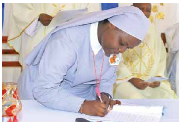
Akt podpisania ślubów

Kiedy zatrzymuję się na chwilę i myślę o mojej drodze w Zgromadzeniu Sióstr Misjonarek św. Piotra Klawera, słowo obuntu wydaje się streszczać głęboką radość, którą odczuwam w sercu. Odkąd w 2013 roku dołączyłam do tej wspólnoty zakonnej, zostałam objęta duchem