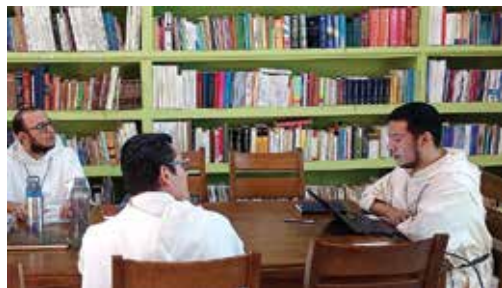
Bracia podczas nauki