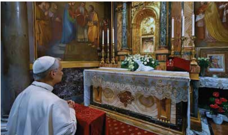
Leon XIV w Sanktuarium Matki Bożej Dobrej Rady

10 czerwca 1904 r. papież Pius X odpowiedział na prośbę Marii Teresy Ledóchowskiej i specjalnym pismem potwierdził wybór Matki Bożej Dobrej Rady jako Patronki Zgromadzenia i dzieła św. Piotra Klawera. Tak przekaza-