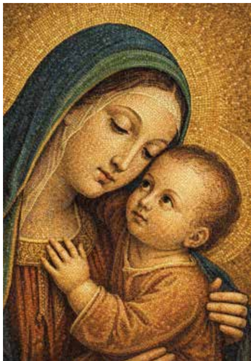
Patronka Zgromadzenia