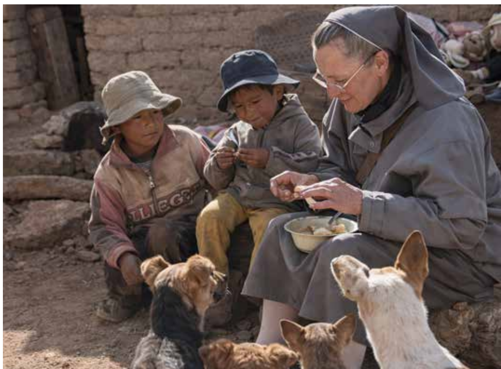
Być blisko ubogich to przywilej, fot. arch. USJK