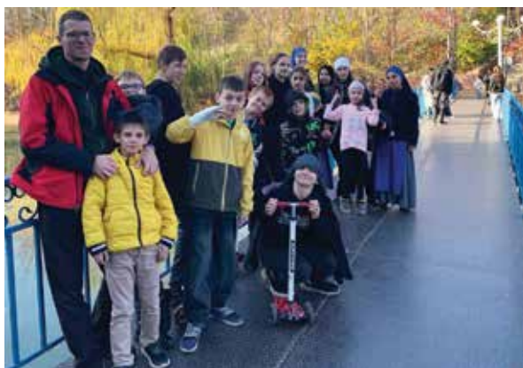
Szczególną troską otaczamy dzieci i młodzież

Pismo Święte przypomina, że Bóg błogosławi tym, którzy dają z radością. My zaś doświadczamy, że Jego łaska działa często w sposób cichy – w codziennej wierności, w sakramentach sprawowanych w niewielkiej wspólnocie i w sercach, które powoli otwierają się na Ewangelię.