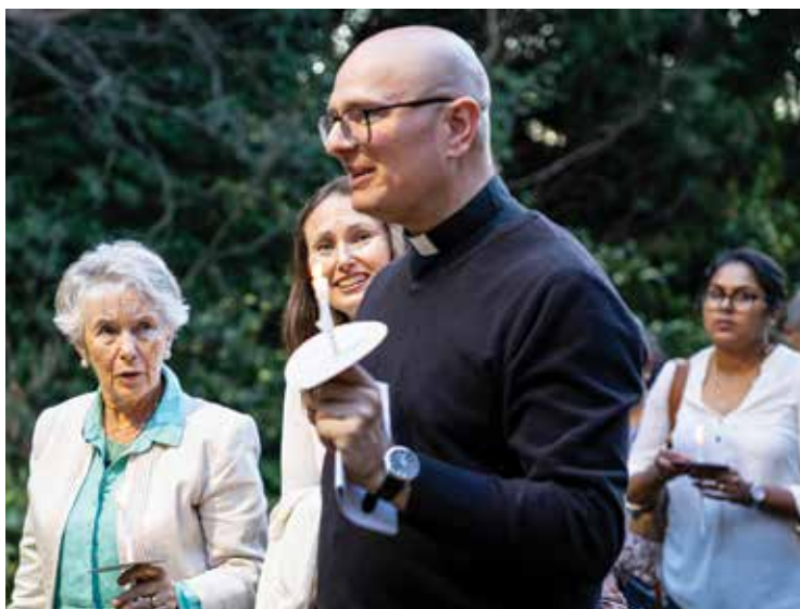
Kapłani potrzebują wsparcia wiernych świeckich

kreśla, że kryzys może stać się momentem wzrostu i dojrzwania. Może być czasem bolesnego, ale twórczego przetwarzania życia, prowadzącego do głębszego zakorzenienia w powołaniu. Kryzys bywa punktem przełomu – momentem, w którym człowiek albo się załamie, albo wejdzie na wyższy poziom rozwoju duchowego i osobowego.