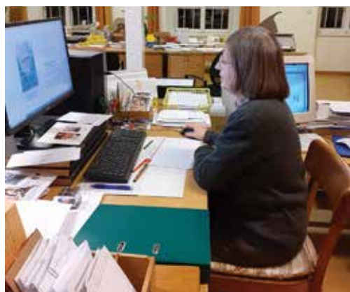
Sekretariat misyjny