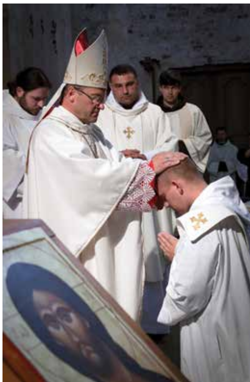
Święcenia prezbiteratu

Kapłaństwo dla wielu mężczyzn stało się nie tylko drogą życia, ale jego sensem i wartością, z którą utożsamili własną tożsamość. W dniu święceń podjęli decyzję realizowania tej drogi przez całe życie, niezależnie od trudnych warunków, jakie może przynieść rzeczywistość Kościoła i świata. Dlaczego więc niektórzy kapłani przeżywają kryzys własnego powołania? Dlaczego u części z nich kryzys ten dotyka samego rdzenia tożsamości kapłańskiej i prowadzi do pragnienia odejścia ze stanu duchownego? Słowo kryzys w potocznym rozumieniu budzi skojarzenia wyłącznie negatywne.