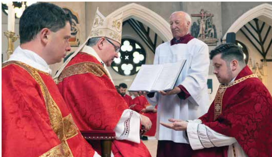
Każde powołanie kapłańskie jest darem, fot. Mazur/cbcew.org.uk

Nie każdy kryzys musi prowadzić do odejścia z kapłaństwa. Psychologia pod-