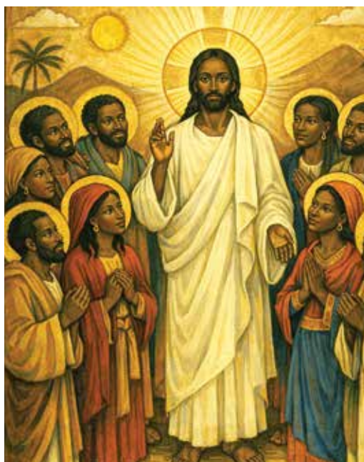
Chrystus zmartwychwstał!

On jest światłem, które rozprasza ciemność i przypomina, że Bóg nigdy nie opuszcza człowieka. Jego obecność trwa