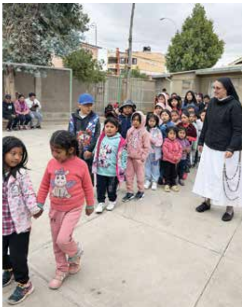
Wiele osób chce pogłębiać wiarę

Dlatego siostry zwracają się z prośbą o pomoc w budowie salek katechetycznych, które umożliwią prowadzenie katechezy oraz spotkań wspólnot parafialnych. Potrzeba ta staje się coraz pilniejsza, ponieważ rośnie liczba osób przygotowujących się do przyjęcia sakramentów i pragnących pogłębiać swoją wiarę.