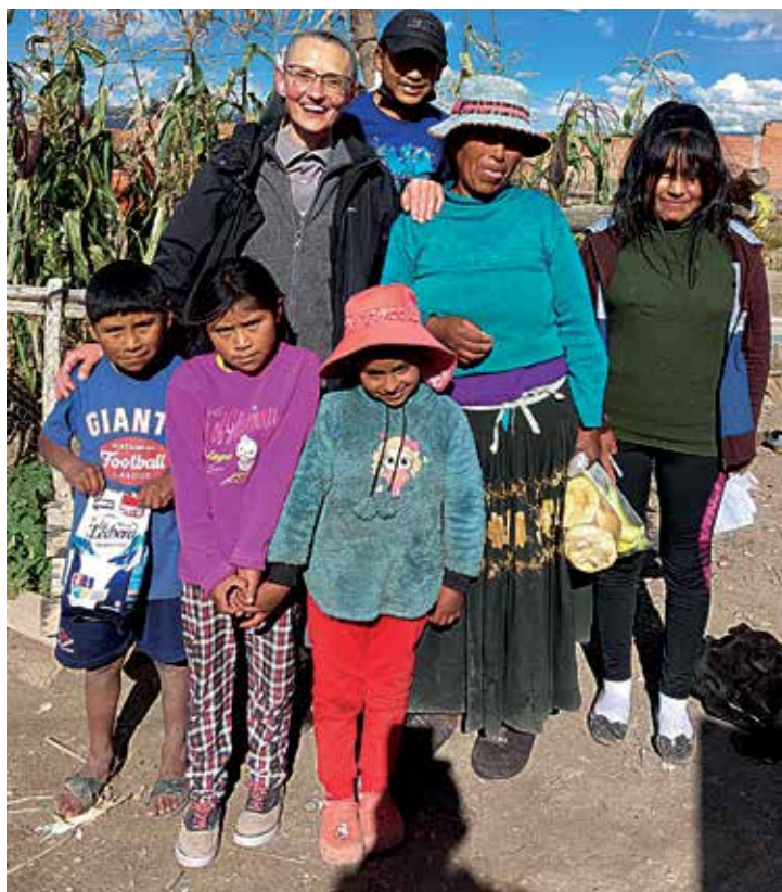
Bycie misjonarką daje wiele radości, fot. G. Małecka