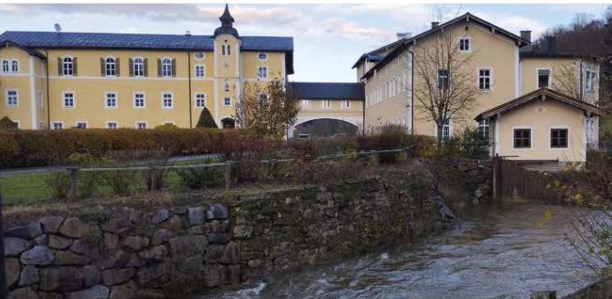
Dom w Maria Sorg to kolebka Zgromadzenia, fot. arch. SSPC

AUSTRIA. W Domu Misyjnym Maria Sorg koło Salzburga, od ponad stu lat bije misyjne serce Zgromadzenia. W Maria Sorg rodziły się inicjatywy wspierające ewangelizację w Afryce i na innych kontynentach. Międzynarodowa wspólnota siostr nadal z wielki zaangażowaniem służy misjom modlitwą, pracą i animacją.