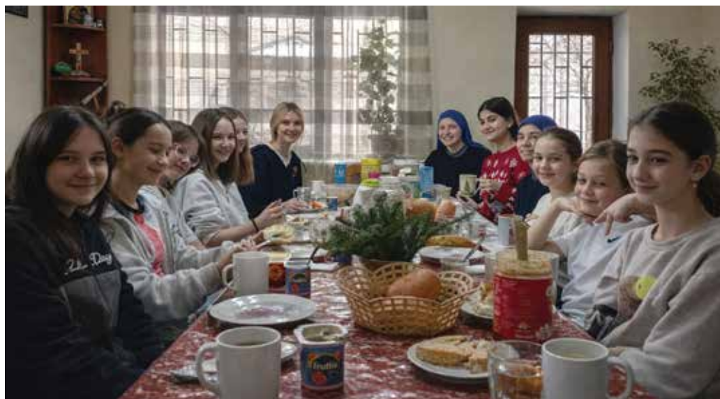
Jadalnia siostr to też miejsce spotkań