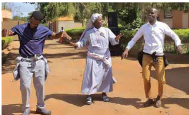
Radość i wdzięczność za dar powołania

obuntu – co w pięknym afrykańskim powiedzeniu oznacza: Jestem tym, kim jestem, ponieważ my jesteśmy tym, kim jesteśmy .