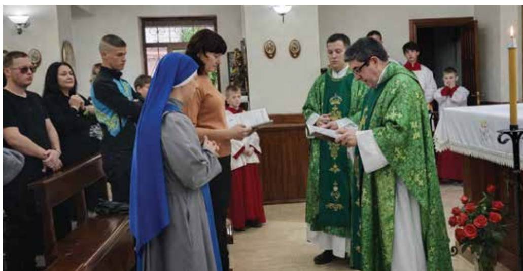
Rozpoczęcie drogi życia sakramentalnego

wypełnia zwyczajną posługą: obecność, rozmowy, modlitwa i katecheza.