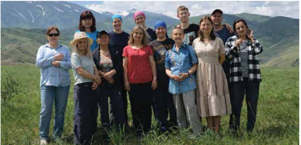
Parafianie to znający się przyjaciele

Patrząc na minione lata, widzimy przede wszystkim wierność Boga. To On prowadzi nas w tej