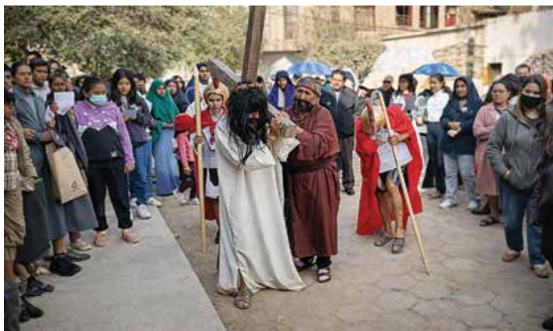
Wielki Piątek jest bardzo uroczystym dniem, fot. G. Małecka

się do Ogrodu Oliwnego; drugą – drogą, którą Jezus, pojmany, przebył do domu arcykapłana Annasza; trzecią – do domu Kajfasza; czwartą – do pretorium Piłata; piątą – do pałacu Heroda; szóstą – ponownie do Piłata, a siódmą jest droga, którą Jezus niósł swój krzyż na Golgotę.