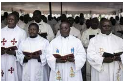
Każdy dar jest cenny

Z wdzięcznością potwierdzamy otrzymanie wsparcia przeznaczonego na zakup ksiąg liturgicznych dla dziewięciu młodych kapłanów naszej diecezji. Dzięki tej pomocy mogą oni godnie sprawować liturgię i pełnić swoją postługę duszpasterską w powierzonych im wspólnotach.